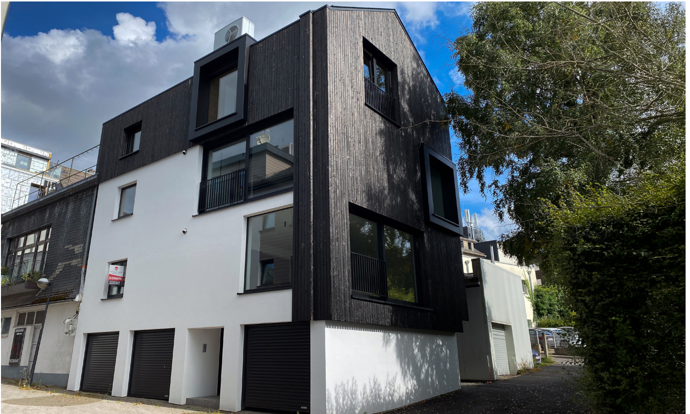
Außenfoto – Vorderansicht