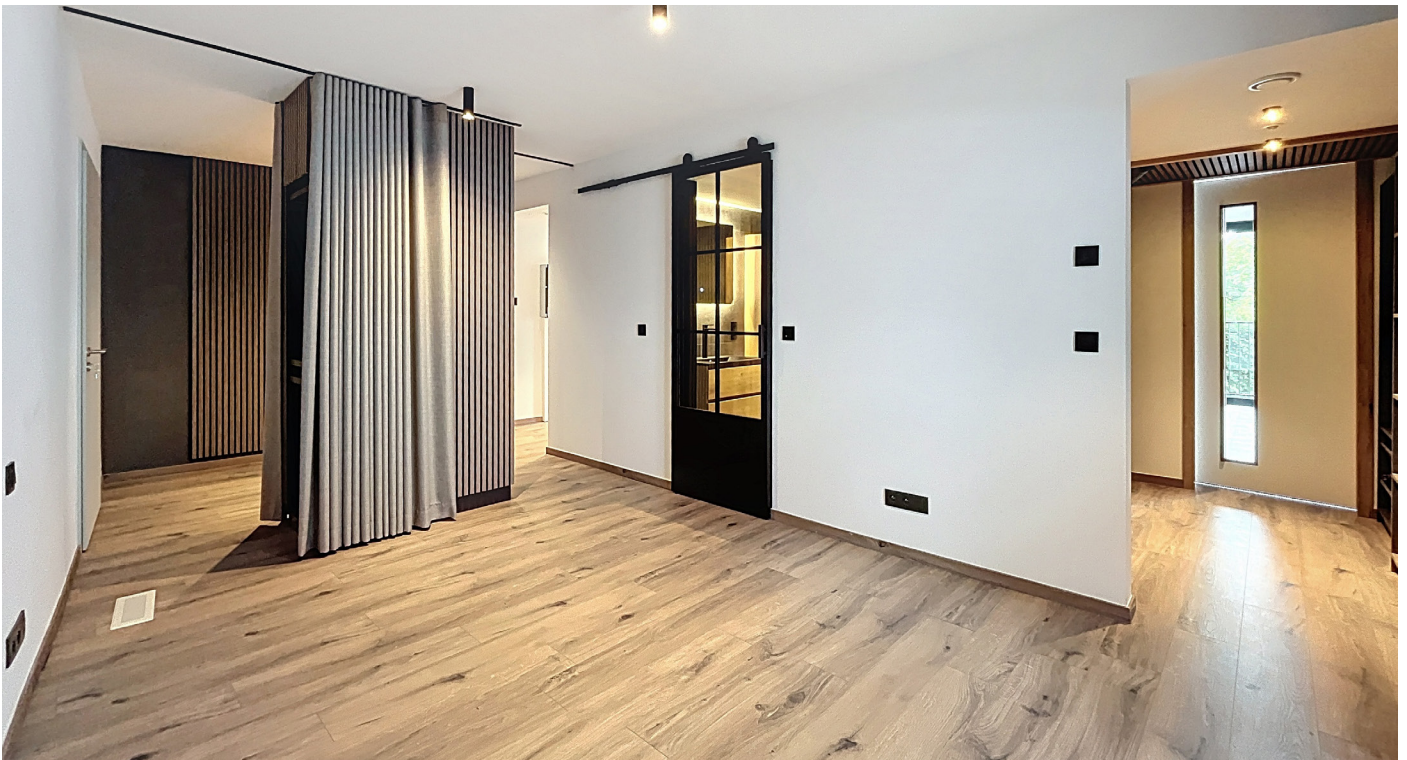
Innenfotos - Schlafzimmer