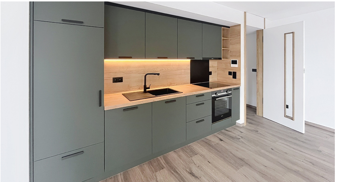
Außenfoto – Küche