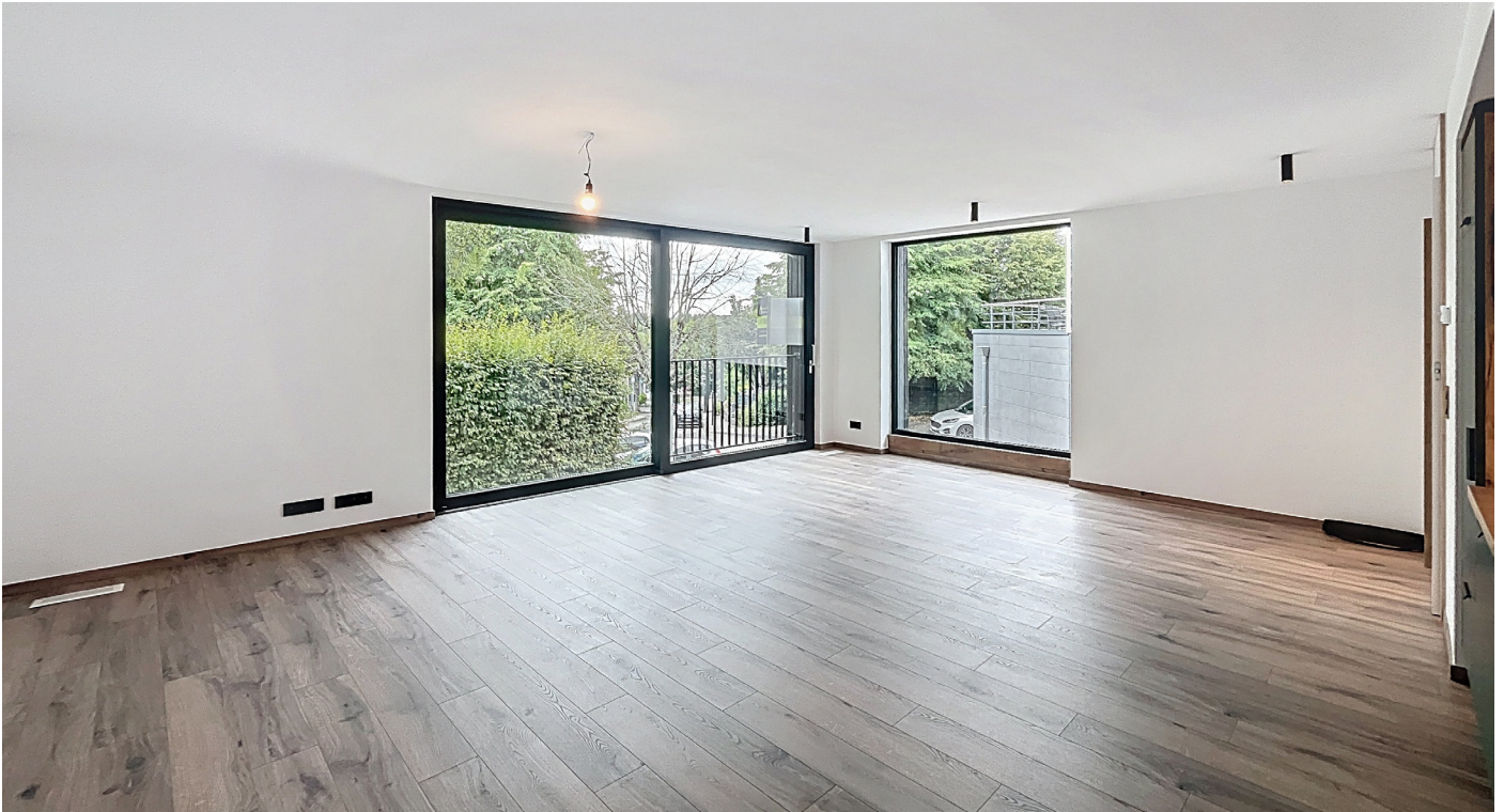
Innenfotos - Wohnzimmer