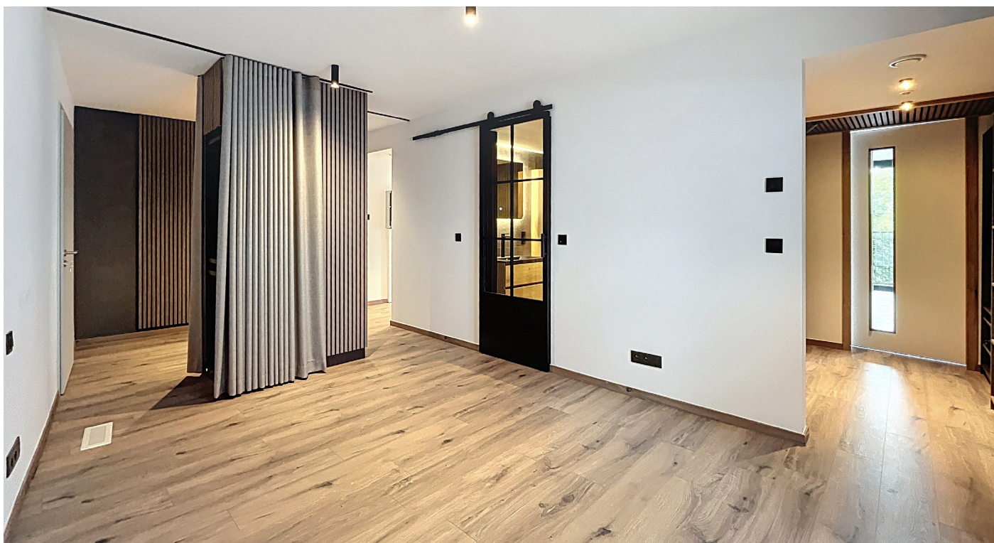
Photo intérieure - chambre