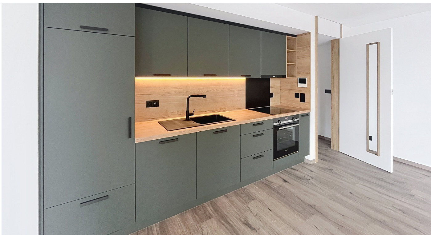
Photo extérieure - cuisine