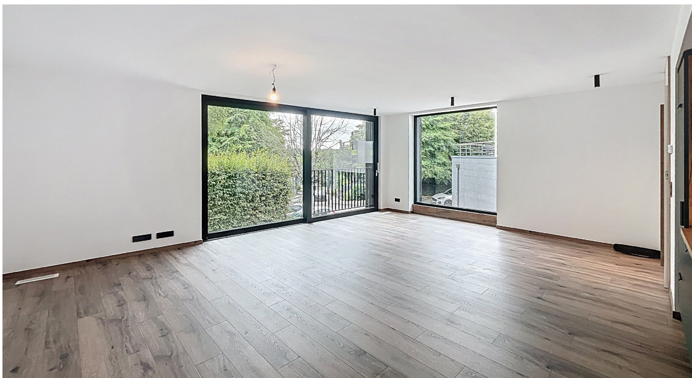
Photo intérieure - salon