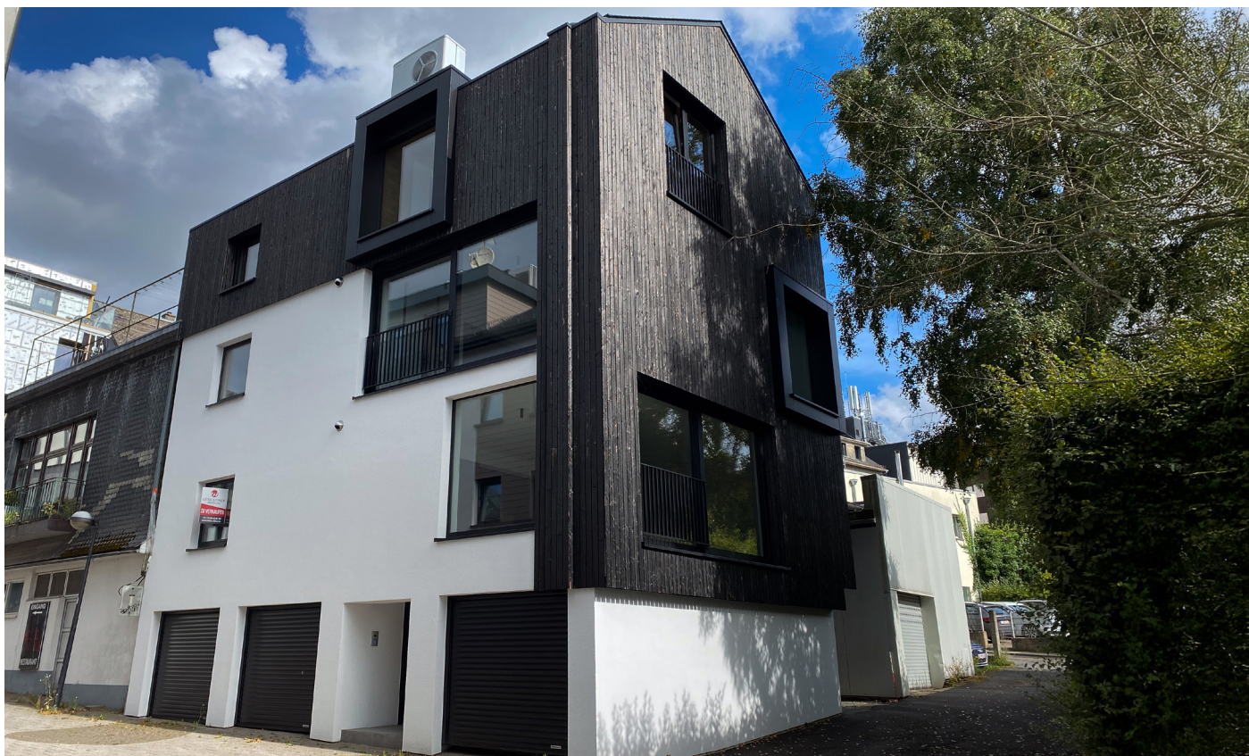
Photo extérieure - façade avant